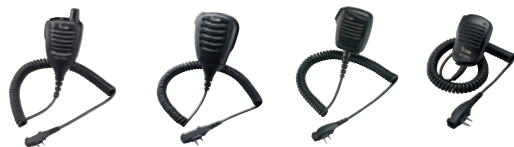
HM-171GPW HM-168LWP HM-159LA HM-158LA

HM-158LA: Kompaktes Lautsprecher-Mikrofon mit 3,5-mm-Stecker