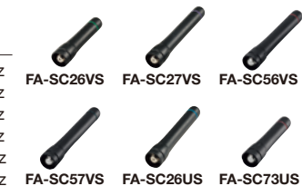
FA-SC26VS FA-SC27VS FA-SC56VS FA-SC57VS FA-SC26US FA-SC73US